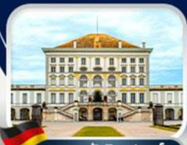
พระราชวังนิมเฟนบวร์ก