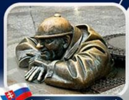
ประติมากรรม Cumil

บาเรียนพลาซซ์ • บ้านเกิดโมสาร์ท • พระราชวังฮอฟบวร์ก • ซาลส์บวร์ก • บ้านเกิดโมสาร์ท • เกรโกเดร์สตรีก • ทะเลสาบคอนิกซ์ • หมู่บ้านอัลลส์ตัทท์ • อนุสาวรีย์มาเรียเทเรซา