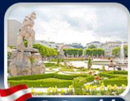
สวนมิรานาวิล ซาลซ์บวร์ก