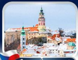
เมืองเชสกี้ กลุมลอฟ