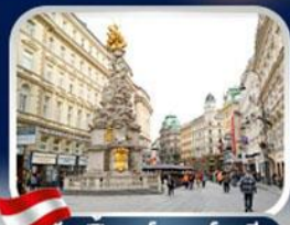
ซ็อบบิงการ์ทเนอร์สตรีก